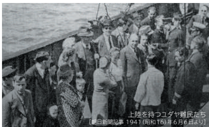
上陸を待つユダヤ難民たち 【朝日新聞記事 1941（昭和16）年6月6日より】