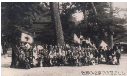
敦賀の松原での孤児たち